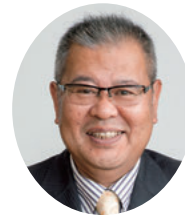
吉村 善明 生駒市議会議長