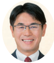
山下 真 奈良県知事