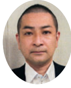
中土 将 西日本電信電話(株) 奈良支店 ビジネス営業部 部長