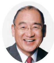
荒井 正吾 奈良県知事