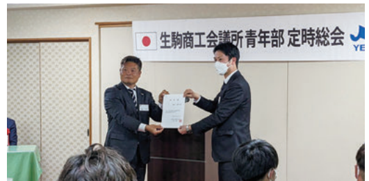
新入部員任命書受け渡しの様子