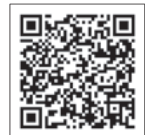
マンガ再就職支援