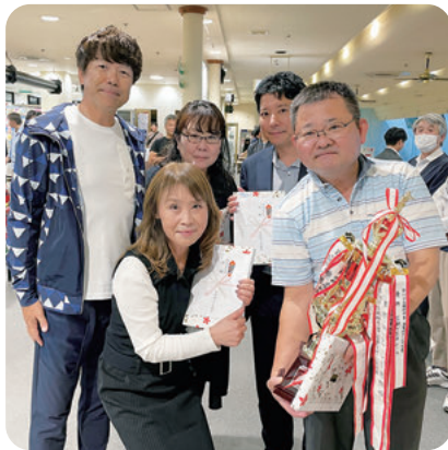
△優勝のひとみ商会&アクサ生命保険(株)合同チームと鐵東会頭