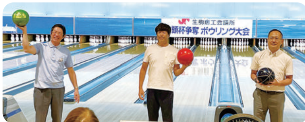
△始球式の様子 上武副会頭(左)、鐵東会頭(中)、中谷副会頭(右)