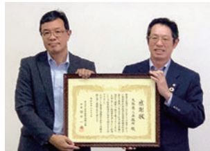
三浦支店長(左)、上武副会頭(右)