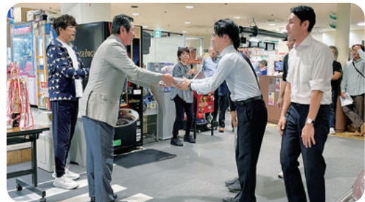
△準優勝の大光宣伝(株)と上武副会頭