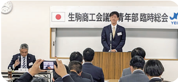
◁ 橋本会長 (左) と 令和 6 年度寺井会長予定者 (中央)

令和 5 年度生駒商工会議所青年部臨時総会が 11 月 7 日 (火)、生駒セイセイビル 402・403 号室で開催されました。出席者は、本人出席 30 名・委任状出席 19 名の計 49 名でした。審議事項として、令和 6 年度生駒商工会議所青年部会長予定者選出及び令和 6 年度生駒商工会議所青年部組織図 (案) が可決承認され、総会は滞りなく閉会しました。