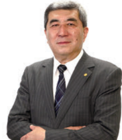
りそな銀行に28年勤務。 平成17年中小企業診断士登録後に開業。