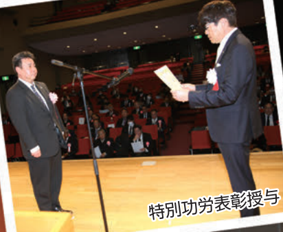
特別功労表彰授与