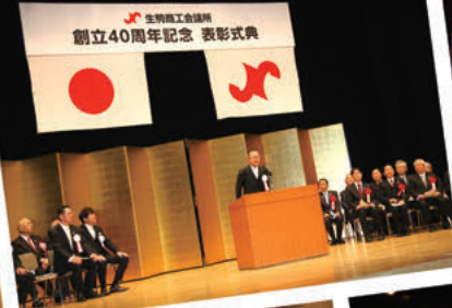
特別功労表彰授与