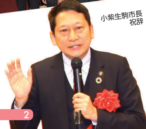
小紫生駒市長 祝辞