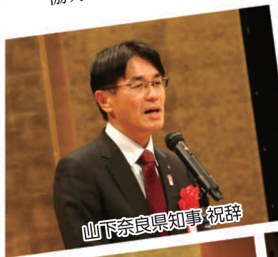
山下奈良県知事 祝辞