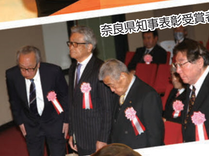
奈良県知事表彰受賞者