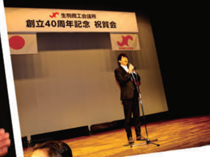
祝賀会 上武副会頭の 中締め