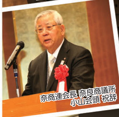
奈商連会長 奈良商議所 小山会頭 祝辞