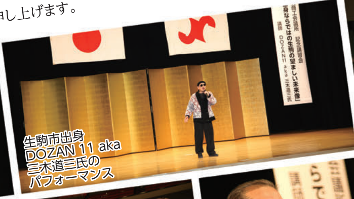
生駒市出身 DOZAN 11 aka 三木道三氏の パフォーマンス