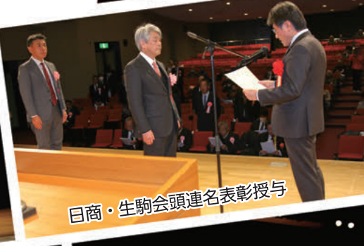
日商・生駒会頭連名表彰授与