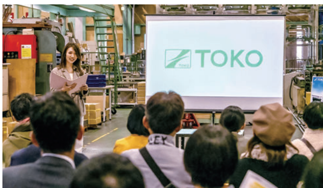
(株)トーコー 変化に順応する対応力を強みに優れた品質とニーズにマッチした建築資材を提供