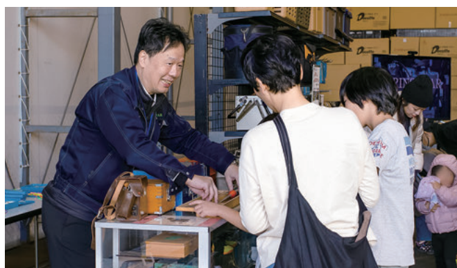
(株)リングスター 「次世代に引き継ぐ」ことができる、信頼と耐久力。