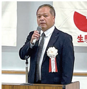
被表彰者を讃える唐金会頭