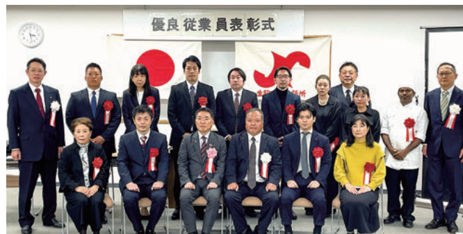
正副会頭・領家副市長と被表彰者の皆様