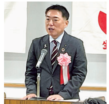
祝辞を述べる領家副市長