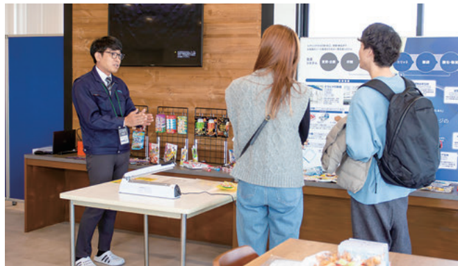
(株)ダイドー 心を包み、開く力へ。