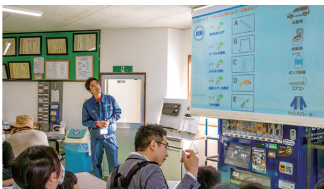
株森田スプリング製作所 創意と誠意のバネづくり