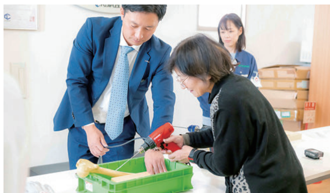
(株)フジフレックス 経験に培われた確かな技術と最先端テクノロジーの融合