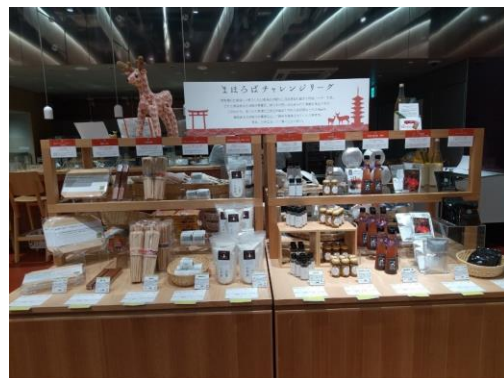
前年度実施の様子